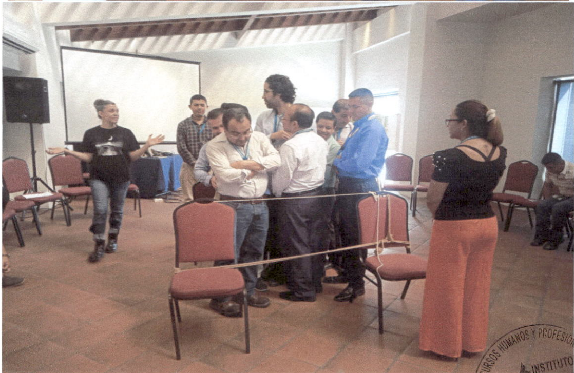
Caja Lúdica Guatemala 2024